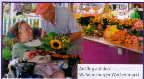
Ausflug auf den Wilhelmsburger Wochenmarkt